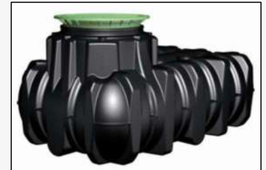
Depósito Platin con cubierta paso peatones