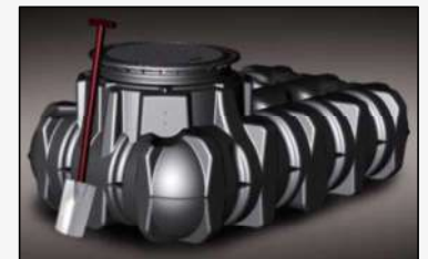
Depósito Platin con cubierta paso vehículos